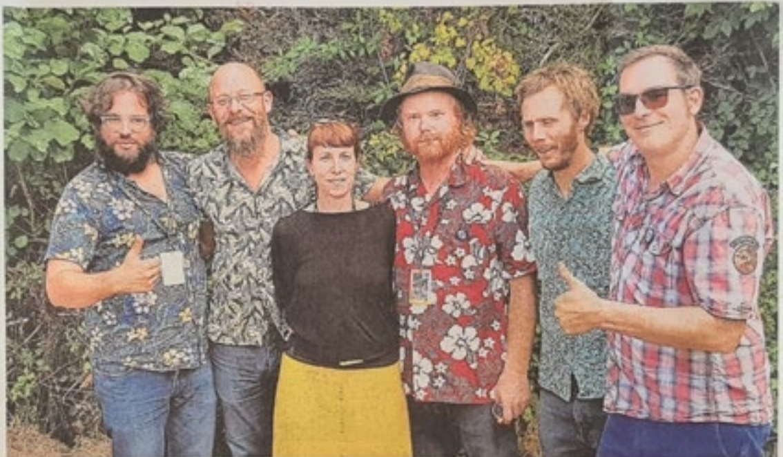
Les Wacky Jugs, groupe de blues breton entre Pontivy et Douarnenez, ont décroché le titre mondial du blues à Memphis, Tennessee.

En lice avec quelque 300 groupes venus du monde entier, le quintet a plus que séduit les différents jurys et