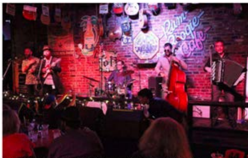
The Wacky Jugs, ici au Rum Boogie Café de Memphis lors des quarts de finale, ont emballé public et jurés américains.