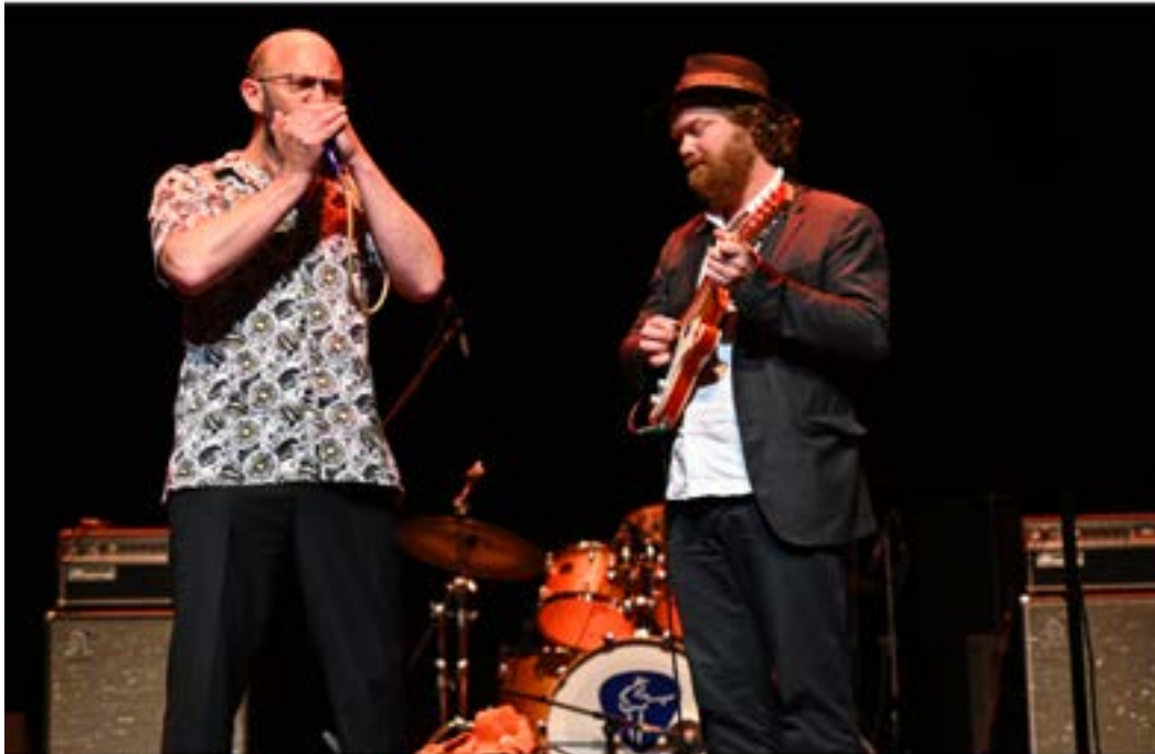
The Wacky Jugs

Winners range from The Wacky Jugs to Jhett Black.