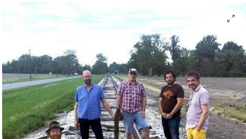
The Wacky Jugs, groupe de blues breton entre Pontivy et Douarnenez, ont décroché le titre mondial du blues à Memphis. Ils seront aux Vieilles Charrues. | THE WACKY JUGS